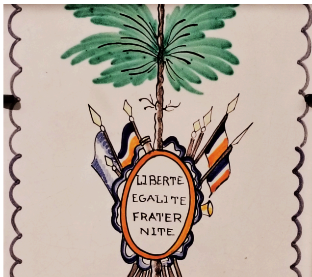
Carreau « Liberté, égalité, fraternité » auteur : Faïencerie Bernard, matière : faïence © Département de la Nièvre - Cité des Présents François Mitterrand

Ces globes incarnent parfaitement sa volonté d'articuler ses mondes locaux et la dimension internationale de son action. François Mitterrand a conservé également longtemps un globe dans son bureau à l'Élysée. Actuellement, certains de ces globes sont visibles dans le bureau à Latche, dans le salon de réception du Quai d'Orsay ou encore au musée François-Mitterrand de Jarnac.