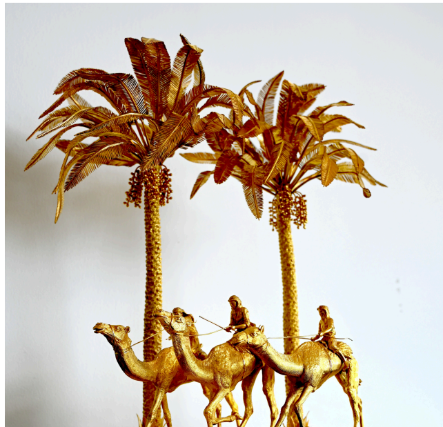
« Scène d'oasis », matière : vermeil, malachite et albâtre