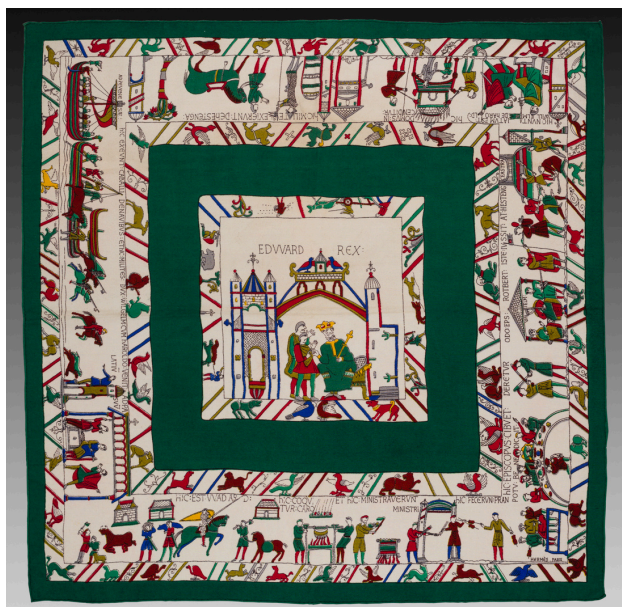
Carré Hermès Edward Rex ou La tapisserie de Bayeux dessiné par Charles Pittner, don Annie Bertrand 1993

En 1937, la maison Hermès, initialement spécialisée dans l'équipement pour cheval et cavalier lance son premier foulard au format carré. Les motifs s'inspirent fréquemment de célèbres œuvres d'art, comme pour celui-ci de la tapisserie de Bayeux.