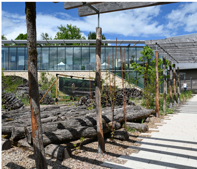
Cité des Présents - François Mitterrand, vue du jardin bas 2026 © Département de la Nièvre - Cité des Présents François Mitterrand