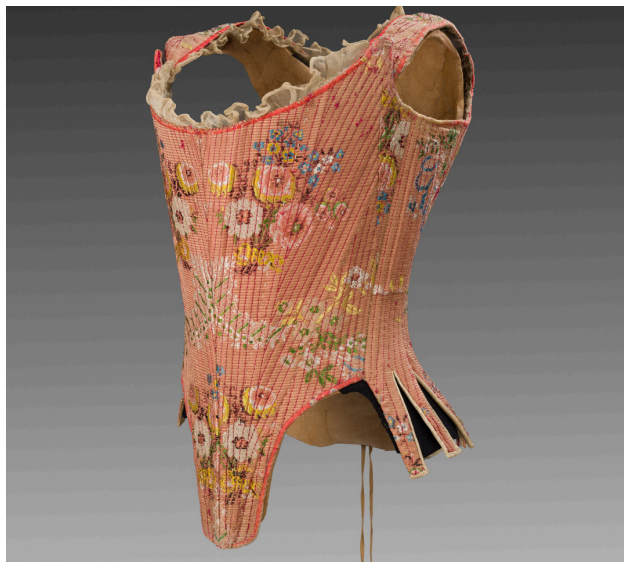
Corps à baleines datant de la première moitié du 18 e siècle. Achat Jules Dardy en 1970.

De la plus ancienne pièce conservée - une bourse de mariage datant de 1690 sous Louis XIV - à une robe créée par Alexis Mabille en 2018, l'ensemble couvre plus de trois siècles d'histoire du vêtement et continue de s'enrichir afin de compléter cette traversée des styles et des époques.