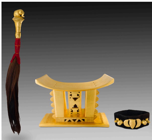
Reproduction d'insignes royaux baoulé en bois doré, velours, métal et fibres animales offert par le président de la république de Côte d'Ivoire