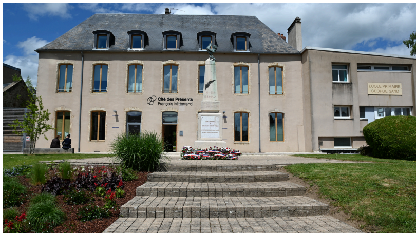
© Département de la Nièvre - Cité des Présents François Mitterrand