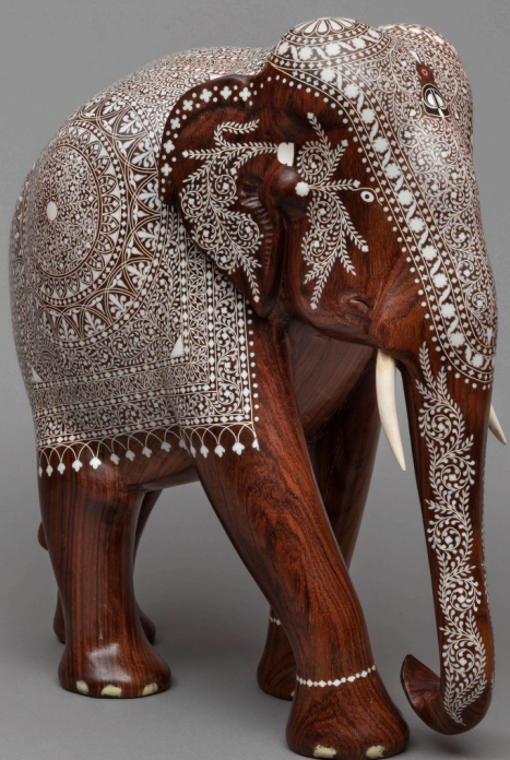
Sculpture d'un éléphant en bois sculpté décoré d'incrustations en ivoire. Offert par le ministre de l'Information indien, le 29 novembre 1982