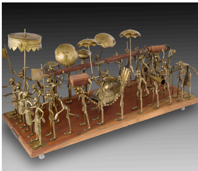
Sculpture du cortège royal constitué de 33 statuettes en métal doré. Offert par le Président de la République du Bénin, le 15 janvier 1983.

François Mitterrand a visité 86 pays durant sa présidence dont environ 80 sont représentés à travers cette collection de 4800 objets.