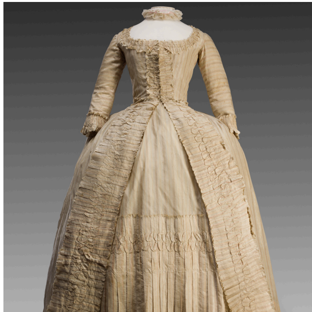
Robe à la française en taffetas de soie, achat Jules Dardy 1970

Au cours de la période 1815-1850, la différence des tenues masculines et féminines s'accroît. Tandis que les femmes portent des tenues colorées et richement ornées, les hommes portent des costumes trois pièces sombres. Le vêtement masculin s'ajuste au corps : cols hauts avec cravates nouées, gilets qui peuvent être corsetés pour exagérer le bombé de la poitrine, redingotes à la taille marquée. Malgré la dominance des couleurs sombres, il reste quelques espaces de fantaisie aux hommes. C'est dans les gilets et les bretelles qu'elle s'exprime, par les couleurs et les motifs.