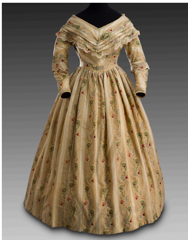
Robe d'après-midi en étamine de laine, achat en vente publique 2015