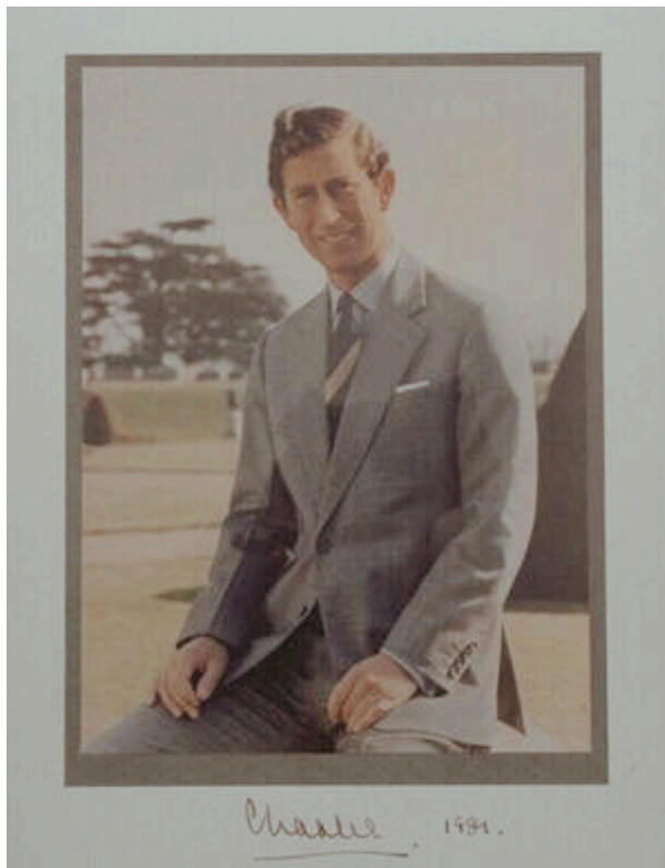
Portrait officiel du Prince Charles, offert par le Royaume-Uni en 1981, photographie couleur.

Ce portrait officiel du prince de Galles, Charles, héritier du Royaume-Uni, a été envoyé à François Mitterrand en 1981. Il s'agit du premier cadeau reçu par François Mitterrand, tout juste élu président de la République française. Ce portrait accompagnait un courrier de félicitations et marque ainsi le début de relations officielles entre le nouveau président français et un membre éminent de la monarchie britannique. Ce n'est pas un cadeau personnellement choisi pour le président Mitterrand, il relève plus d'une tradition, qui trouve son origine lointaine dans une pratique courante des cours princières au Moyen Âge : offrir son portrait pour se faire connaître. Le premier contact entre deux dirigeants, qu'il soit par courrier ou en personne, donne encore aujourd'hui souvent lieu à un échange de photographies dédicacées.