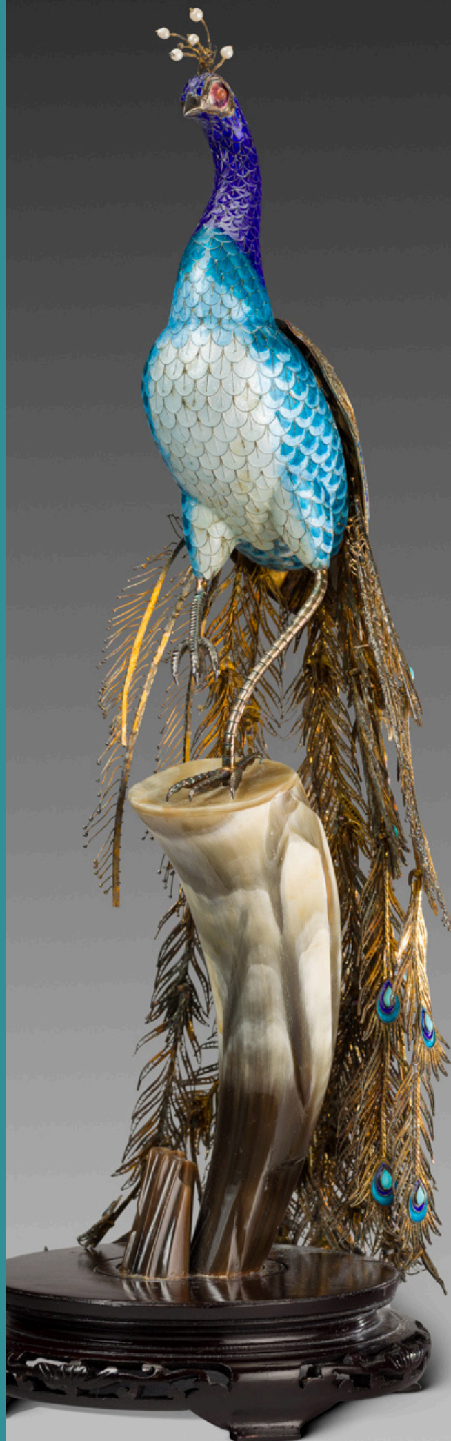
Paon en émail et métal doré.

Offert par le roi du Cambodge le 8 août 1984.