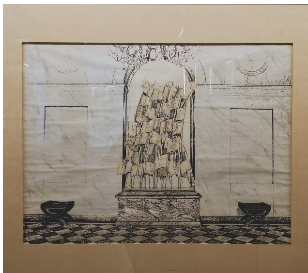
Hommage à la Révolution de 1789, auteur : Arman (1928-2005), matière : lithographie, encre sur papier.

Des regalia baoulé ont également été offerts à d'autres présidents français comme Valéry Giscard d'Estaing en 1978, lors de son déplacement également à Yamoussoukro ou encore à Jacques Chirac (un portrait en chef tribal baoulé, très proche de celui de François Mitterrand sauf qu'il intègre l'un des emblèmes de la France - un coq, est aujourd'hui visible au musée de Sarran, en Corrèze).