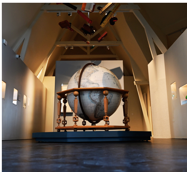
Globe, auteur : Fernand Pouillon (1912-1986) matière : bois et papier cartonné