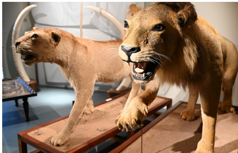
Lion et lionne, taxidermie. Offerts par le président de la République centrafricaine André Kolingba, à Bangui, le 13 décembre 1984.

Carte envoyée d'Ho Chi Minh le 11 février 1993