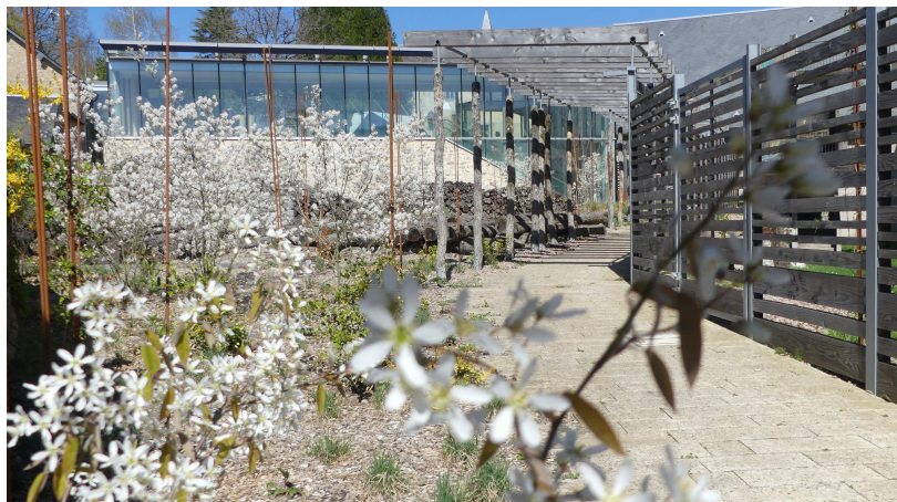
© Département de la Nièvre - Cité des Présents François Mitterrand

Des dispositifs d'aide à la découverte des deux parcours de visite sont à emprunter à l'accueil : un sac 'Muséojeux' et une mallette 'Mon p'tit musée' pour jouer en famille ou en groupe avec les collections.